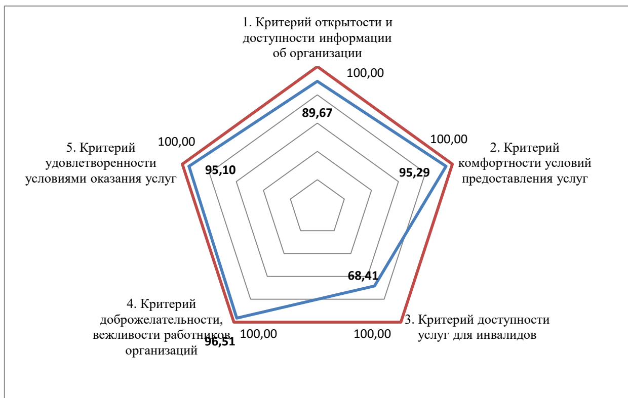
Рисунок – 2 Значения критериев независимой оценки качества условий оказания услуг образовательными организациями Республики Ингушетия